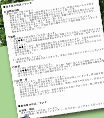
空き家管理アドバイス(例)