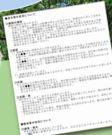
空き家管理アドバイス(例)